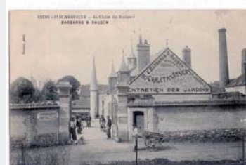
carte postale datée de 1907, rue des Rosiers, démolie en 2002