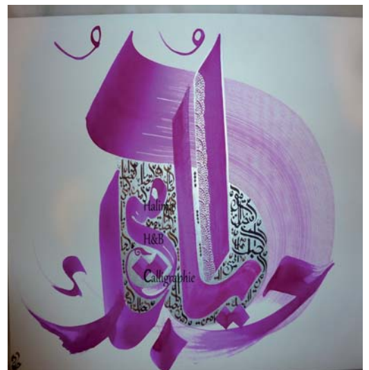
Je t'aime Maman en calligraphie arabe

Pour en savoir plus et voir d'autres calligraphies de l'artiste, rendez-vous sur : Halima H & B Calligraphie