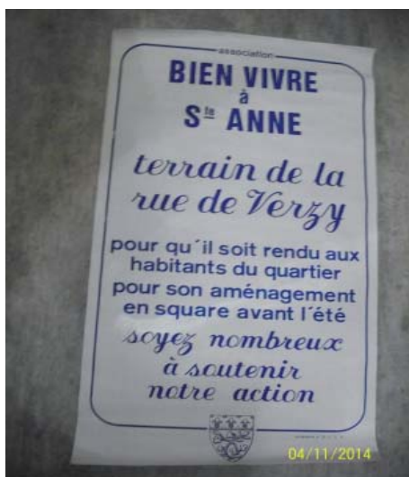
Souvenir de 1978 . Déjà il y a 36 ans les habitants se mobilisaient

@@@@@@@@@@@@@@@@@@@@@@@@@@@@@@@@@@@@@@@@@@@@@@@@@@@@@@@@@@@@