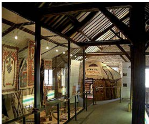
Visite du musée du Feutre, de l'abbatiale de MOUZON et du musée de l'aviation de DOUZY