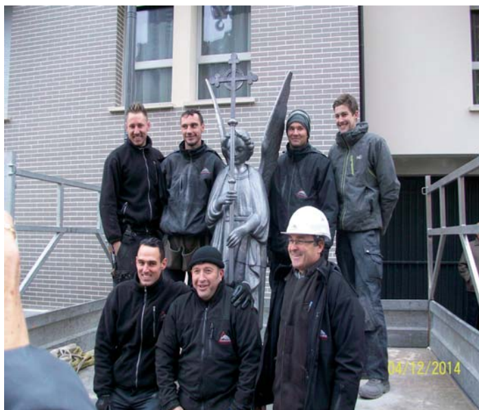
La touche finale: le 4 /12/2014, l'ange a été réinstallé

La Basilique Sainte-Clotilde reprend du service. Après presque 3 années de repos forcé, le quartier va s'animer et fêter cet événement sur 2 jours.