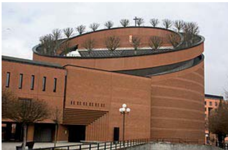
Visite de la cathédrale d'EVRY et du musée de la toile de JOUY en JOSAS

@@@@@@@@@@@@@@@@@@@@@@@@@@@@@@@@@@@@@@@@@@@@@@@@@@@@@@@@@@@@