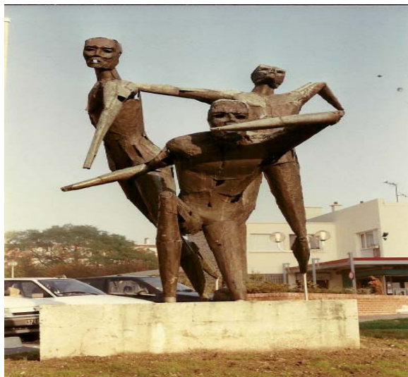
Les Guetteurs de Pierre FILLIOS

@@@@@@@@@@@@@@@@@@@@@@@@@@@@@@@@@@@@@@@@@@@@@@@@@@@@@@@@@@@@